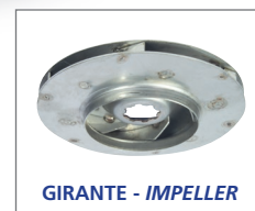
GIRANTE - IMPELLER