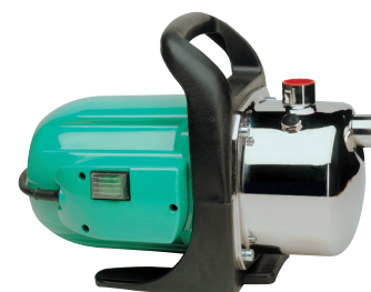
CAM 88 CR

P1 1100 watt Q max. 50 l/min H max. 46 m