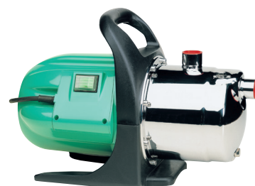
CAM 98 CR

P1 1100 watt Q max. 50 l/min H max. 46 m