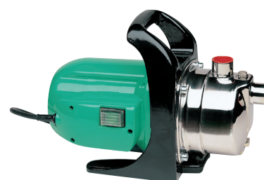
CAM 80 CR