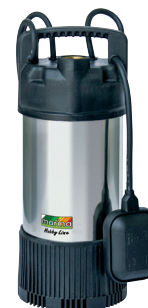
SMC 1103 HL

P1 1100 watt Q max. 120 l/min H max. 38 m