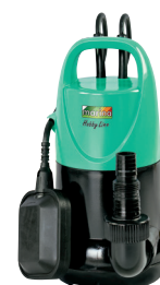
STS 200 HL

P1 250 watt Q max. 90 l/min H max. 5,3 m