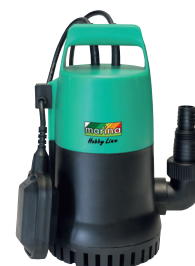
STS 300 HL

P1 250 watt Q max. 90 l/min H max. 5,3 m