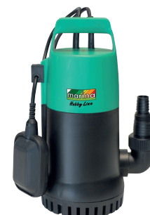
STS 800 HL

P1 300 watt Q max. 140 l/min H max. 6,9 m